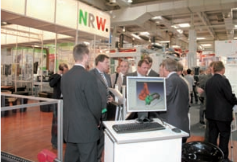
Das TechnologieZentrumDortmund (TZDO) ist auf der Hannover Messe 2008, der weltweit wichtigsten Plattform für technische Innovationen, wie im letzten Jahr auch an zwei Messeständen vertreten.