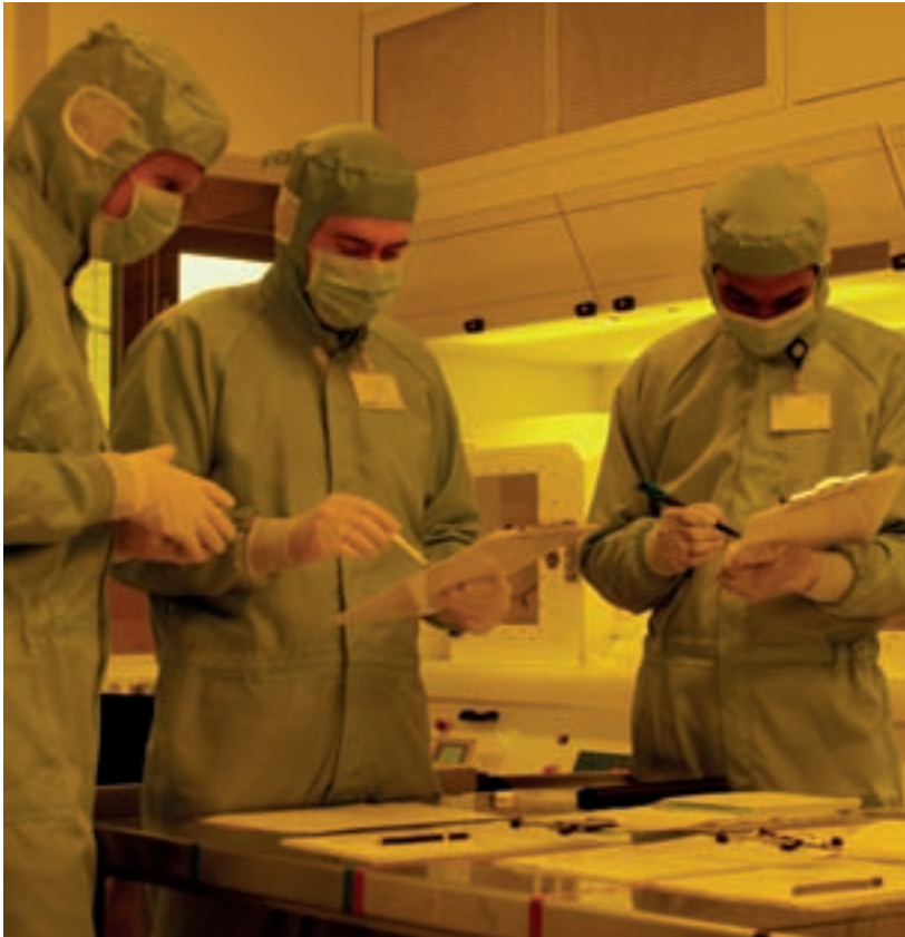
Innolume baut seine Entwicklungskapazitäten aus, um die steigende Nachfrage nach seinen neuartigen Lasern zu befriedigen.

Oft scheitert das Vorhaben, eine Fahrgemeinschaft zu gründen, daran, die passenden Kollegen zu finden. Genau dabei will eine Projektgruppe des Business- und Management Trainee-Programms der frankepartner GmbH helfen. Sie hat ein Konzept für eine kostenlose Internetplattform entwickelt, die MitfahrTec . Darüber sollen Mitarbeiter aus dem TechnologieParkDortmund Fahrgemeinschaften organisieren können. Das Konzept „MitfahrTec“ wird am 15. Oktober 2008 um 14.30 Uhr im TechnologieZentrumDortmund, Raum 2070, vorgestellt. Interessierte möchten sich bitte per E-Mail an projekt-fahrgemeinschaften@intercultural-consulting.de anmelden.